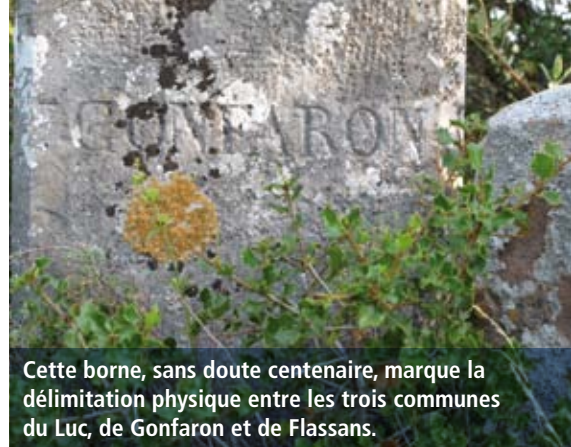
Cette borne, sans doute centenaire, marque la délimitation physique entre les trois communes du Luc, de Gonfaron et de Flassans.