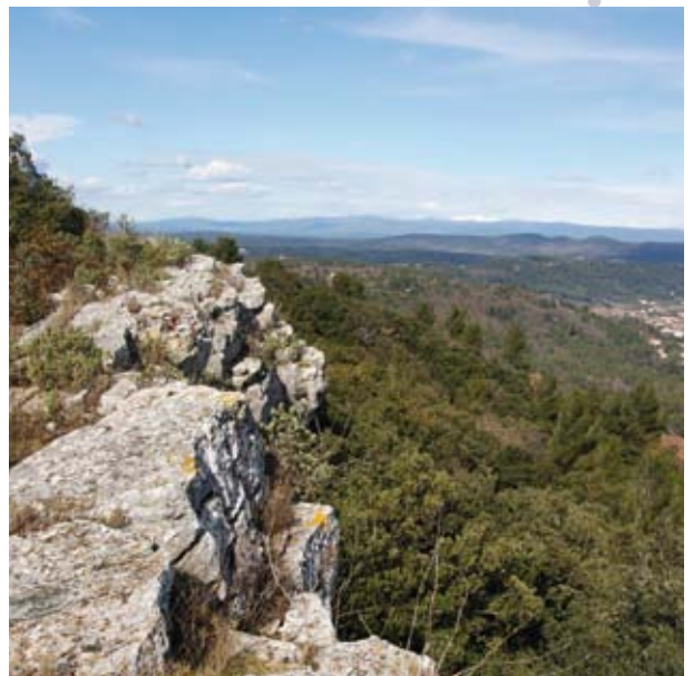
Photo de couverture : Semaine varoise de la randonnée pédestre à Gonfaron.

Dépôt légal à parution. N° ISSN : 1638-9255.