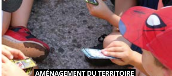
AMÉNAGEMENT DU TERRITOIRE